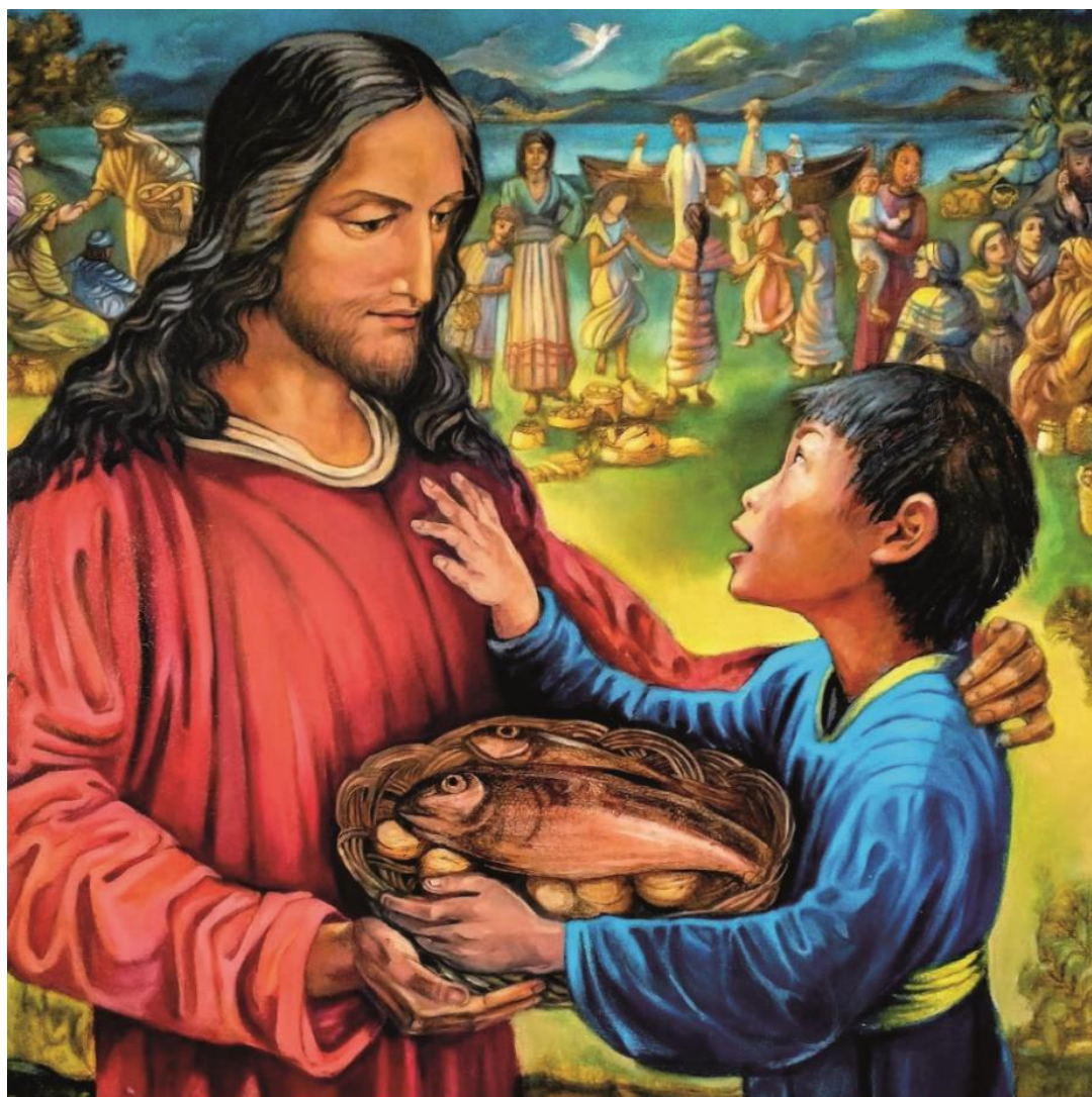
Nous avons faim de donner ton pain. Huile sur toile, Anne-Marie Forest, 2022